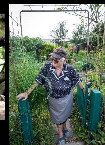
to the formation of the Pacific Ring of Fire, especially in the western Pacific Ocean (GREEN, 2002; de la NO, 2002). The study of the tectonic evolution of the region is important for understanding the geological evolution of the area (GREEN, 2002). The study of the tectonic evolution of the region is important for understanding the geological evolution of the area (GREEN, 2002).