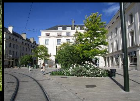
Place du Maréchal - Cédex 9 - 94500 P. MEN