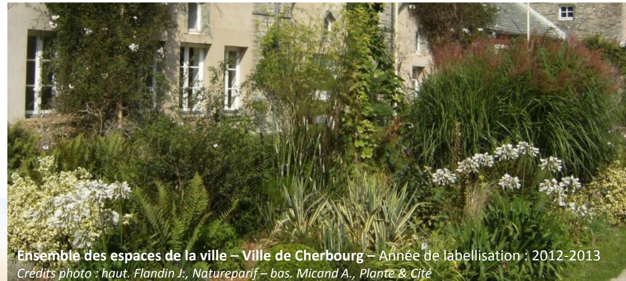
Ensemble des espaces de la ville – Ville de Cherbourg – Année de labellisation : 2012-2013