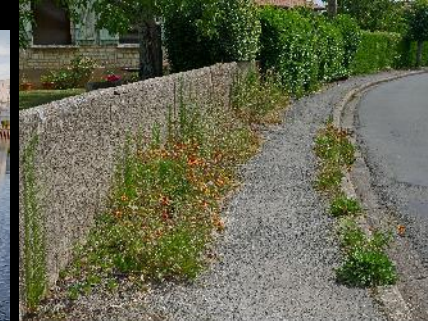
Accession ID: D0001264 C. CLAW