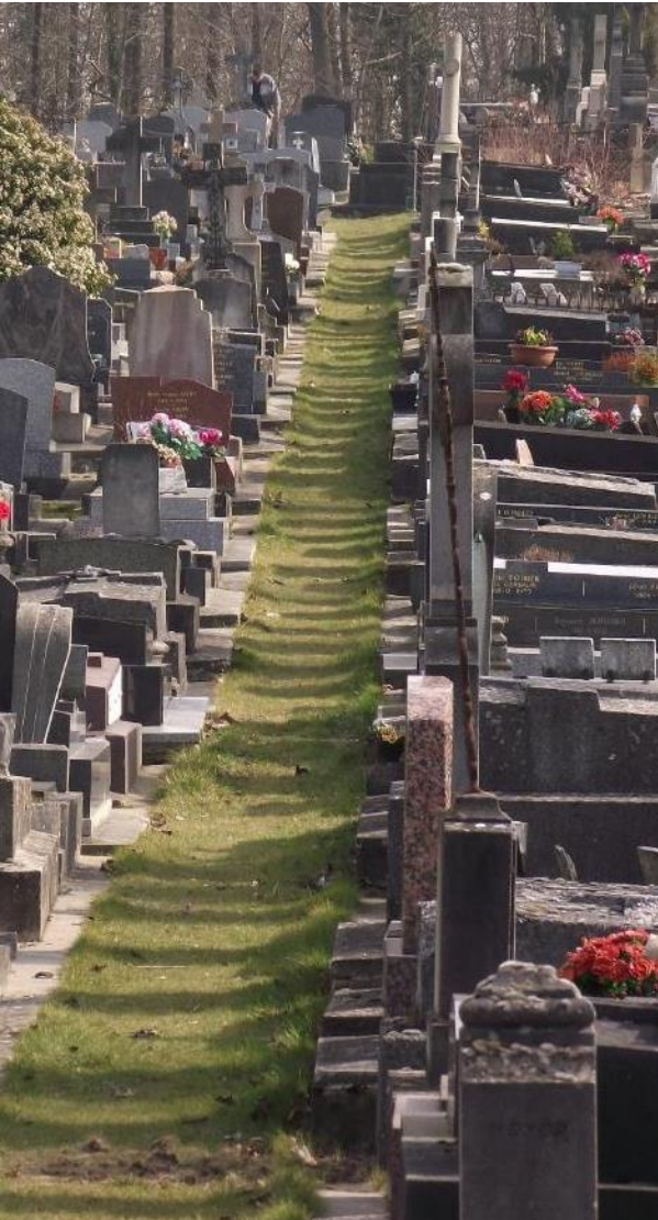
Cimetière des Gonards – Ville de Versailles – Année de labellisation : 2012