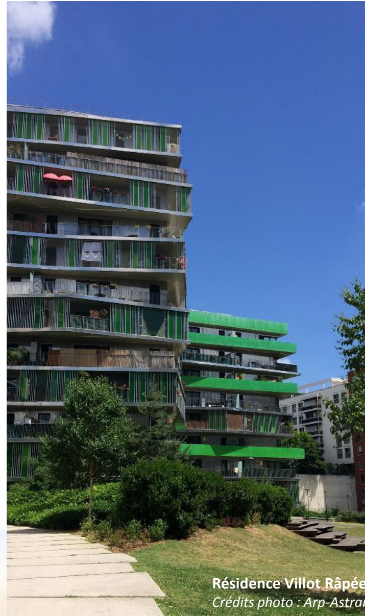
Résidence Villot Râpée – Paris Habitat – Années de labellisation : 2018