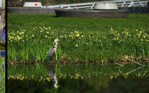
Fare Conferences: Type 62; 4, 1, 200, 50, 1000