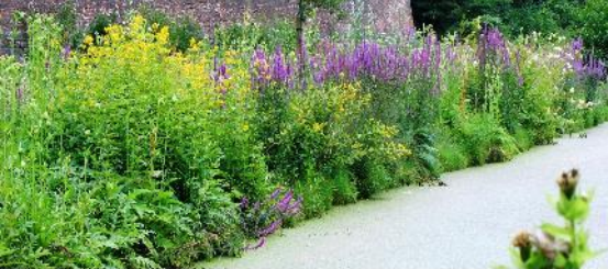
Parc de la Citadelle - Lille (59) M. LISON