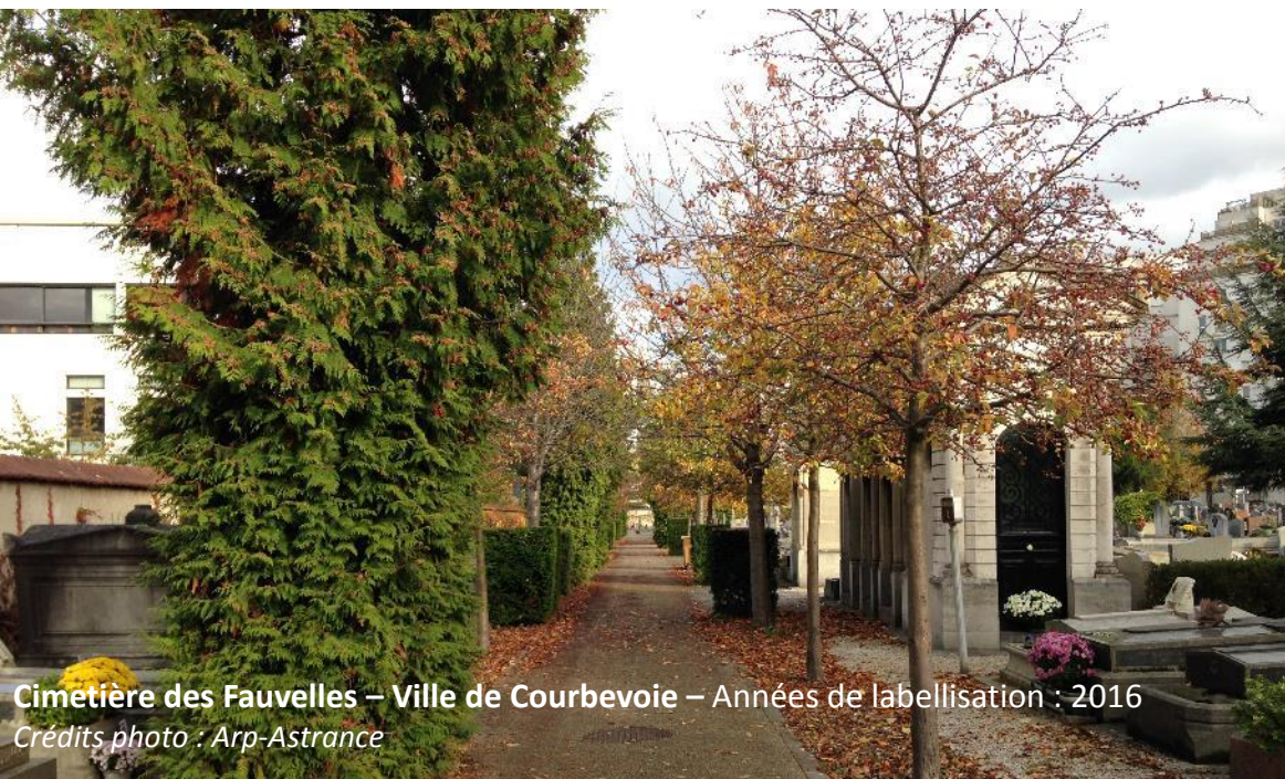
Cimetière des Fauvelles – Ville de Courbevoie – Années de labellisation : 2016