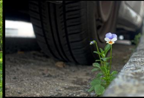
KEITH L. CUMMINS, NAYOK, 44, O.C. EXPLORER 1981-82, 1983-84, 1985-86, 1987-88, 1989-90, 1991-92, 1993-94, 1995-96, 1997-98, 1999-00, 2001-02, 2003-04, 2005-06, 2007-08, 2009-10, 2011-12, 2013-14, 2015-16, 2017-18, 2019-20, 2021-22, 2023-24, 2025-26, 2027-28, 2029-30, 2031-32, 2033-34, 2035-36, 2037-38, 2039-40, 2041-42, 2043-44, 2045-46, 2047-48, 2049-50, 2051-52, 2053-54, 2055-56, 2057-58, 2059-60, 2061-62, 2063-64, 2065-66, 2067-68, 2069-70, 2071-72, 2073-74, 2075-76, 2077-78, 2079-80, 2081-82, 2083-84, 2085-86, 2087-88, 2089-90, 2091-92, 2093-94, 2095-96, 2097-98, 2099-00, 2101-02, 2103-04, 2105-06, 2107-08, 2109-10, 2111-12, 2113-14, 2115-16, 2117-18, 2119-20, 2121-22, 2123-24, 2125-26, 2127-28, 2129-30, 2131-32, 2133-34, 2135-36, 2137-38, 2139-40, 2141-42, 2143-44, 2145-46, 2147-48, 2149-50, 2151-52, 2153-54, 2155-56, 2157-58, 2159-60, 2161-62, 2163-64, 2165-66, 2167-68, 2169-70, 2171-72, 2173-74, 2175-76, 2177-78, 2179-80, 2181-82, 2183-84, 2185-86, 2187-88, 2189-90, 2191-92, 2193-94, 2195-96, 2197-98, 2199-00, 2201-02, 2203-04, 2205-06, 2207-08, 2209-10, 2211-12, 2213-14, 2215-16, 2217-18, 2219-20, 2221-22, 2223-24, 2225-26, 2227-28, 2229-30, 2231-32, 2233-34, 2235-36, 2237-38, 2239-40, 2241-42, 2243-44, 2245-46, 2247-48, 2249-50, 2251-52, 2253-54, 2255-56, 2257-58, 2259-60, 2261-62, 2263-64, 2265-66, 2267-68, 2269-70, 2271-72, 2273-74, 2275-76, 2277-78, 2279-80, 2281-82, 2283-84, 2285-86, 2287-88, 2289-90, 2291-92, 2293-94, 2295-96, 2297-98, 2299-00, 2301-02, 2303-04, 2305-06, 2307-08, 2309-10, 2311-12, 2313-14, 2315-16, 2317-18, 2319-20, 2321-22, 2323-24, 2325-26, 2327-28, 2329-30, 2331-32, 2333-34, 2335-36, 2337-38, 2339-40, 2341-42, 2343-44, 2345-46, 2347-48, 2349-50, 2351-52, 2353-54, 2355-56, 2357-58, 2359-60, 2361-62, 2363-64, 2365-66, 2367-68, 2369-70, 2371-72, 2373-74, 2375-76, 2377-78, 2379-80, 2381-82, 2383-84, 2385-86, 2387-88, 2389-90, 2391-92, 2393-94, 2395-96, 2397-98, 2399-00, 2401-02, 2403-04, 2405-06, 2407-08, 2409-10, 2411-12, 2413-14, 2415-16, 2417-18, 2419-20, 2421-22, 2423-24, 2425-26, 2427-28, 2429-30, 2431-32, 2433-34, 2435-36, 2437-38, 2439-40, 2441-42, 2443-44, 2445-46, 2447-48, 2449-50, 2451-52, 2453-54, 2455-56, 2457-58, 2459-60, 2461-62, 2463-64, 2465-66, 2467-68, 2469-70, 2471-72, 2473-74, 2475-76, 2477-78, 2479-80, 2481-82, 2483-84, 2485-86, 2487-88, 2489-90, 2491-92, 2493-94, 2495-96, 2497-98, 2499-00, 2501-02, 2503-04, 2505-06, 2507-08, 2509-10, 2511-12, 2513-14, 2515-16, 2517-18, 2519-20, 2521-22, 2523-24, 2525-26, 2527-28, 2529-30, 2531-32, 2533-34, 2535-36, 2537-38, 2539-40, 2541-42, 2543-44, 2545-46, 2547-48, 2549-50, 2551-52, 2553-54, 2555-56, 2557-58, 2559-60, 2561-62, 2563-64, 2565-66, 2567-68, 2569-70, 2571-72, 2573-74, 2575-76, 2577-78, 2579-80, 2581-82, 2583-84, 2585-86, 2587-88, 2589-90, 2591-92, 2593-94, 2595-96, 2597-98, 2599-00, 2601-02, 2603-04, 2605-06, 2607-08, 2609-10, 2611-12, 2613-14, 2615-16, 2617-18, 2619-20, 2621-22, 2623-24, 2625-26, 2627-28, 2629-30, 2631-32, 2633-34, 2635-36, 2637-38, 2639-40, 2641-42, 2643-44, 2645-46, 2647-48, 2649-50, 2651-52, 2653-54, 2655-56, 2657-58, 2659-60, 2661-62, 2663-64, 2665-66, 2667-68, 2669-70, 2671-72, 2673-74, 2675-76, 2677-78, 2679-80, 2681-82, 2683-84, 2685-86, 2687-88, 2689-90, 2691-92, 2693-94, 2695-96, 2697-98, 2699-00, 2701-02, 2703-04, 2705-06, 2707-08, 2709-10, 2711-12, 2713-14, 2715-16, 2717-18, 2719-20, 2721-22, 2723-24, 2725-26, 2727-28, 2729-30, 2731-32, 2733-34, 2735-36, 2737-38, 2739-40, 2741-42, 2743-44, 2745-46, 2747-48, 2749-50, 2751-52, 2753-54, 2755-56, 2757-58, 2759-60, 2761-62, 2763-64, 2765-66, 2767-68, 2769-70, 2771-72, 2773-74, 2775-76, 2777-78, 2779-80, 2781-82, 2783-84, 2785-86, 2787-88, 2789-90, 2791-92, 2793-94, 2795-96, 2797-98, 2799-00, 2801-02, 2803-04, 2805-06, 2807-08, 2809-10, 2811-12, 2813-14, 2815-16, 2817-18, 2819-20, 2821-22, 2823-24, 2825-26, 2827-28, 2829-30, 2831-32, 2833-34, 2835-36, 2837-38, 2839-40, 2841-42, 2843-44, 2845-46, 2847-48, 2849-50, 2851-52, 2853-54, 2855-56, 2857-58, 2859-60, 2861-62, 2863-64, 2865-66, 2867-68, 2869-70, 2871-72, 2873-74, 2875-76, 2877-78, 2879-80, 2881-82, 2883-8