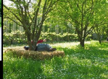
Refuge: ouï-oui, 100, rue de la Vierge, 17000, SAINT-PAUL-DE-SENNECE 05 47 00 00 00, www.sannece.com