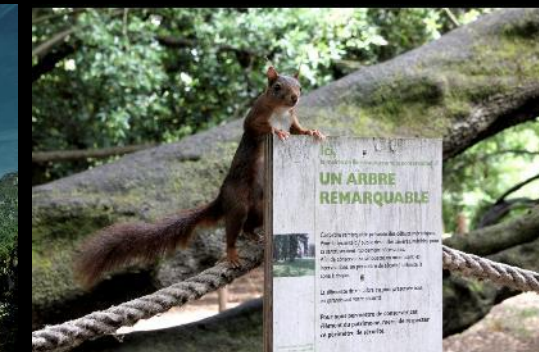
Barb. K. & F. C. - Barb. K. & F. C. (53) O. L. H. 5.18.18 Barb. K. & F. C. (53) O. L. H. 5.18.18