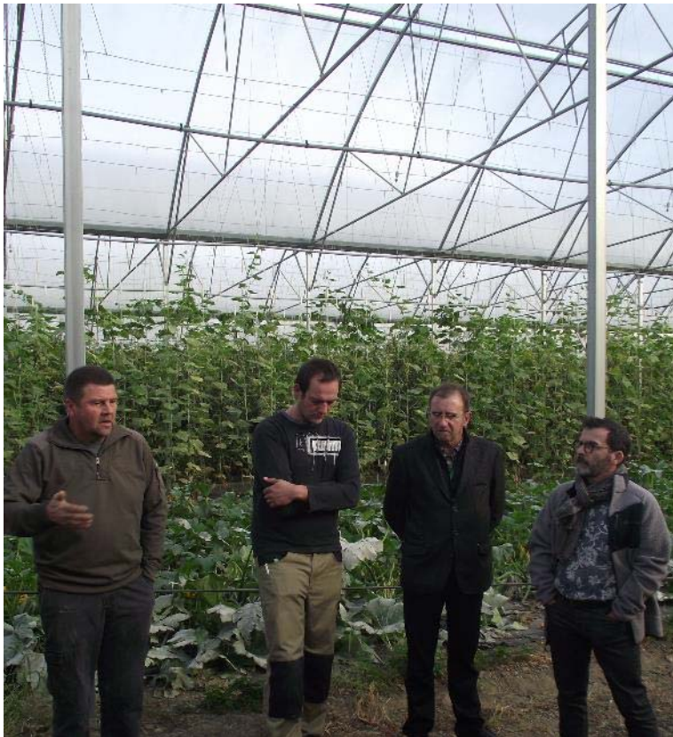
Ilot de la Meinau, Strasbourg