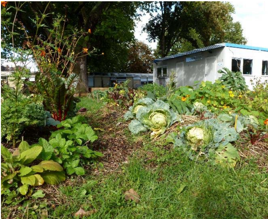
Potager expérimental collectif, Lille