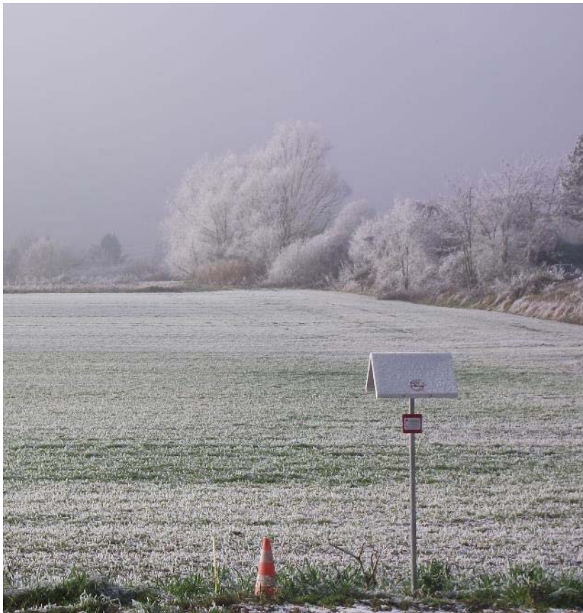
Triangle vert, Essonne / A. Micand, Plante & Cité