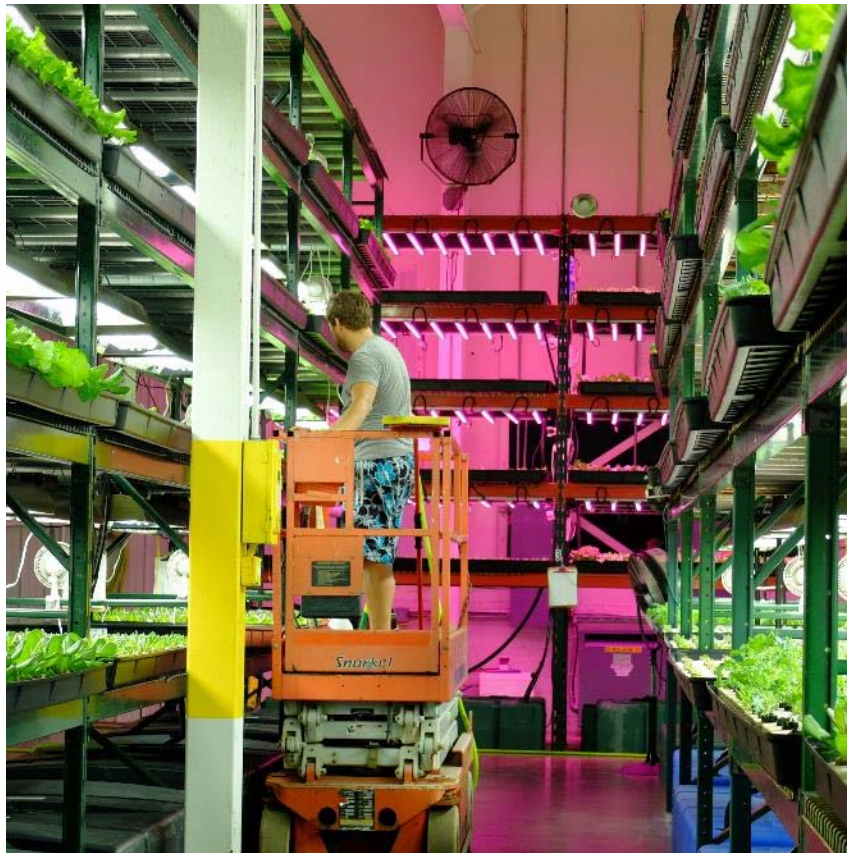
Green Spirit Farm, New Buffalo