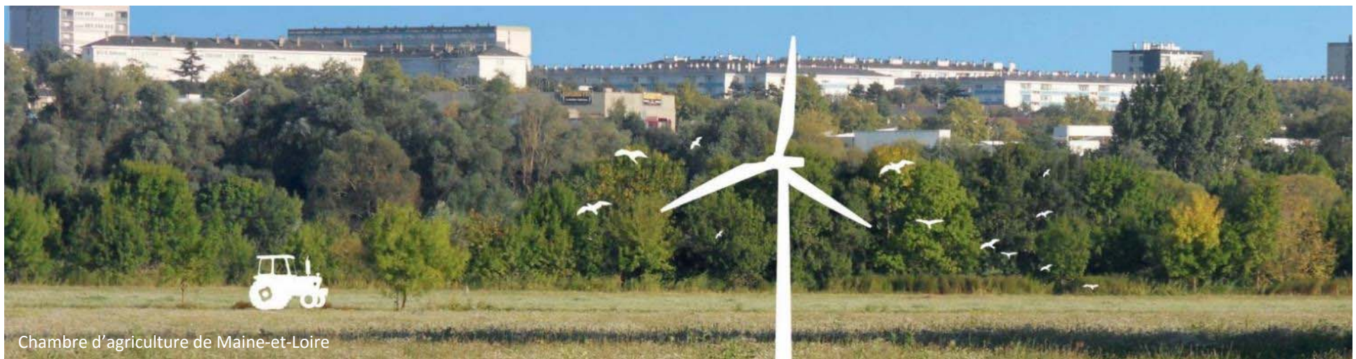
Chambre d'agriculture de Maine-et-Loire

« Nous proposons de définir l'agriculture urbaine comme l'agriculture pratiquée et vécue dans une agglomération par des agriculteurs et des habitants aux échelles de la vie quotidienne et du territoire d'application de la régulation urbaine. Dans cet espace, les agricultures – professionnelles ou non, orientées vers les circuits longs, les circuits courts ou l'autoconsommation – entretiennent des liens fonctionnels réciproques avec la ville (alimentation, paysage, récréation, écologie) donnant lieu à une diversité de formes agri-urbaines observables dans le ou les noyaux urbains, les quartiers périphériques, la frange urbaine et l'espace périurbain. » (Nahmias et Le Caro, 2012)