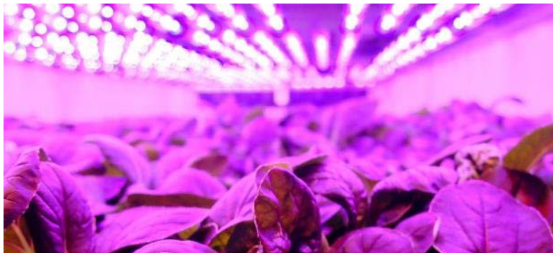
Aerofarms, Newark, Etats-Unis